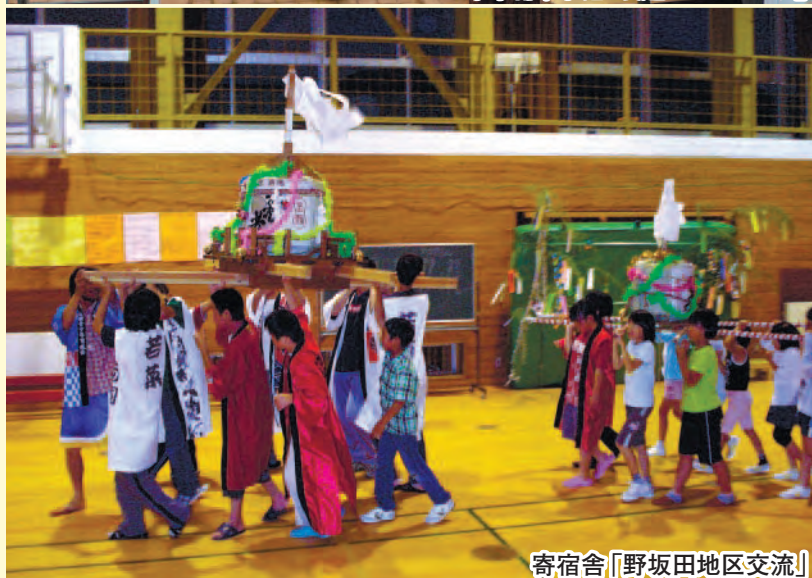
寄宿舎「野坂田地区交流」