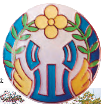
飯山養護学校校章