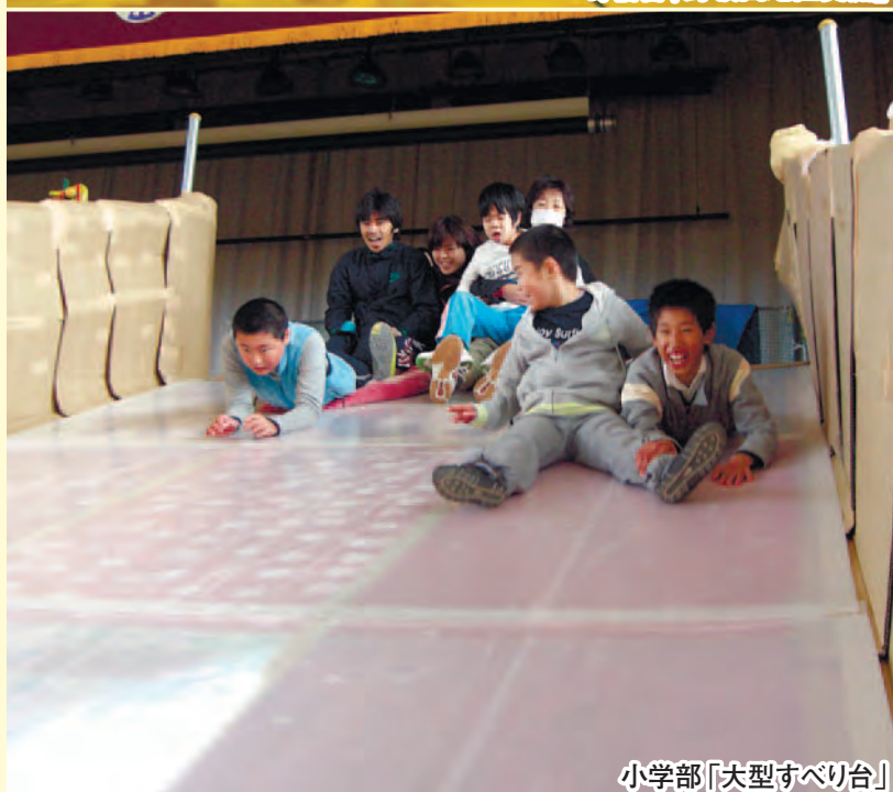
小学部「大型すべり台」