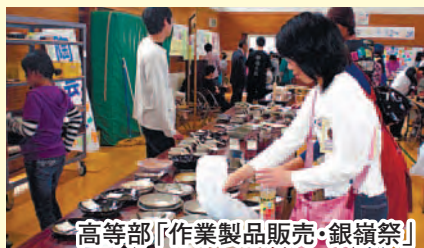
高等部「作業製品販売・銀嶺祭」

小学部32名・中学部26名・高等部45名の児童生徒が、学校教育目標「○明るく素直な子○みんなと共に育つ子○心と体をきたえる子○働くことに喜びをもつ子」を目指して学んでいます。小学部では「体ほぐし」や「遊びの生活単元学習」を中核にして体を動かして楽しみながら遊びこむ活動や、自由な制作活動等を行っています。中学部では自分達の手で中庭を良くしたいという思いから中庭改造をテーマにした生活単元学習を進めています。高等部では将来の生活に生きて働く力の育成を目指して日頃の作業単元学習から現場実習へとつながる教育課程を組んでいます。この他各部ともに個別の課題学習を行う「あゆみの時間」を設け、「満足感・達成感」を目指した一人一人に応じた学習を目指して展開しています。学校内にある寄宿舎「若菜寮」ではゆったりした集団生活を営み、健全な心身・基本的な生活習慣が身につくよう、余暇活動（サークル活動）の充実を願った取り組みを行っています。