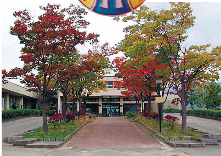
飯山養護学校校門景(秋)