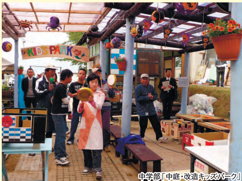
中学部「中庭・改造キッズパーク」