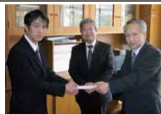
▲北相木村太鼓クラブ「しんか」