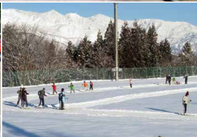
大町市立美麻小中学校