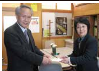
▲中野市立長丘小学校