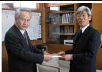
▲木島平村立木島平中学校