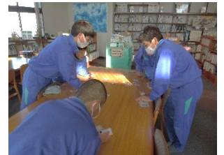
カルタでくつろぐ休み時間

読書には情報や知識を得るための本と、文章から物語を味わうための本が混在する。まれに「読む本がない」と呟く生徒は読みたいと思える本に出会っていないだけであり、どの生徒にも興味の持てる本は必ずあると信じている。その出会いづくりにそっと手を貸すためにフロアワークが生きてくる。休み時間の利用は本好きな生徒、読書は苦手としながらも息抜きに来る生徒、わずかな時間を惜しみ学習に向かう生徒と様々である。また入館しなくても入館できない生徒もいることを意識の中に入れ、日常の何気ない会話からコミュニケーションを心掛けている。