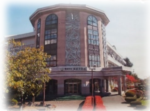
図書館部分のモダンな外観

本校は諏訪湖畔から市街地東部に位置し遠く富士山と北アルプスを望む自然景観に恵まれた学区にある。学校