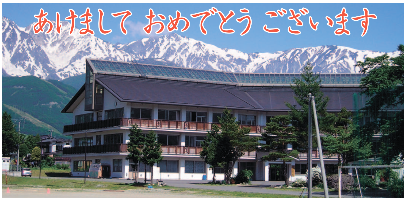
白馬村立白馬中学校