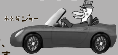
東京海上ニッヨー