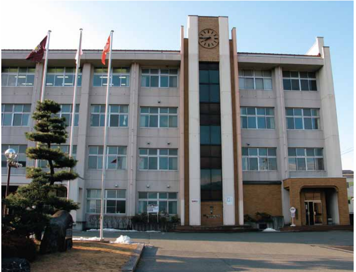
飯田HOIDE長姫高等学校