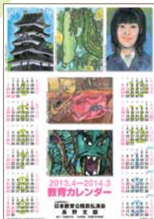
● 中信版 ●