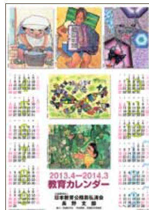
● 南信版 ●