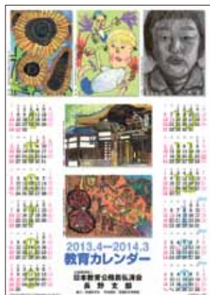
● 北信版 ●

2013年度教育カレンダーが出来上がりました。今年度も、北信・東信・中信・南信版の4種類を制作しました。信濃教育会様にご協力いただき、それぞれの地区の児童・生徒達の絵の入ったデザインとなっています。県内全学校に差し上げておりますので、是非ご活用下さい。なお、カレンダーは順次お届けしております。