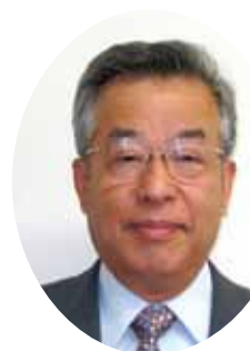
(公財)日本教育公務員弘済会 長野支部