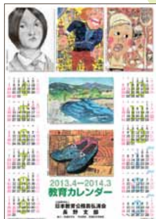
● 東信版 ●