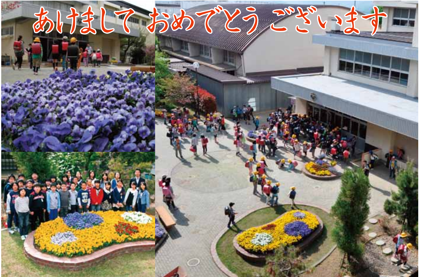
長野市立芹田小学校