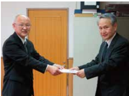
▲須坂園芸高等学校