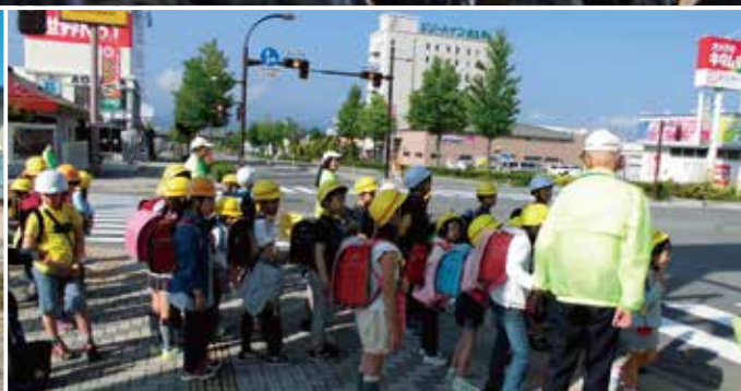
佐久市立佐久平浅間小学校