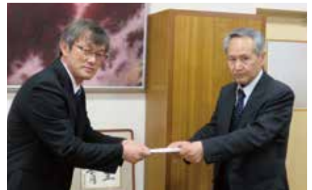
▲長野市立西条小学校