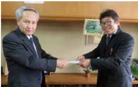
▲須坂市立日野小学校