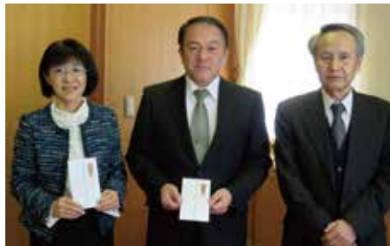
▲長野吉田高校 戸隠分校