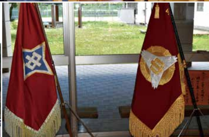
木曽町立木曽町中学校