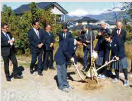
▲創立70周年を記念し桜の植樹式(11月)

今年度、地域の奥田神社より創立70周年を記念して「一葉」という10本の八重桜の苗木を寄贈いただき、11月に植樹式を行いました。まだ、細く、小さな苗木ではありますが、卒業生、地域の方々が見守る中、大きく育ち、いつの日か桜の木の下に人々が集う日が楽しみです。豊かな自然の中で、温かく見守ってくださる地域の方々と共に、これからも歩み続けていきたいと思ひます。