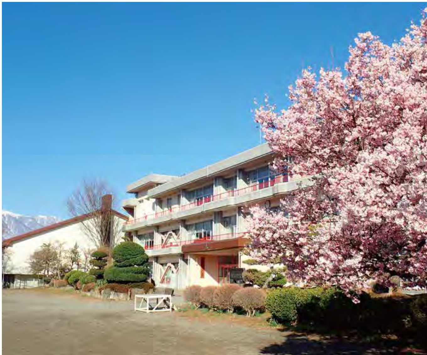
伊那市立手良小学校