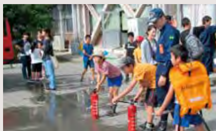
親子ふれあい活動…地域の方を講師にキャリア教育