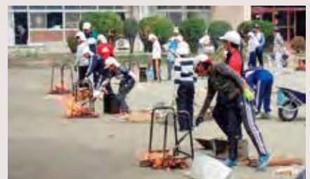
秋の自然に親しむ日…縦割り班でのカレーづくり