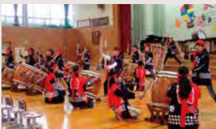
音楽会…手良活性化ふれあい太鼓の発表