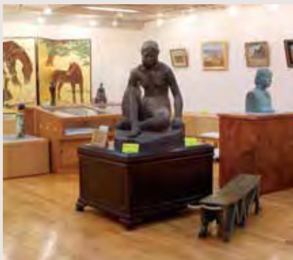
校長室の隣にある泰阜学校美術館の展示室

このように、地域の方から学ぶ活動を多く取り入れて、学校教育目標である、豊かな人間性をもち、たくましく未来を切り拓く子どもの育成を目指しています。