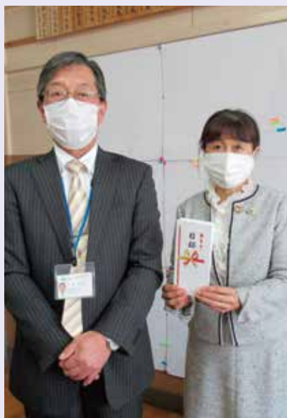
長野市立七二会小学校にて

今年度は、東信地区と南信地区の公立小学校より、5月31日締切で申請を受け付けます。