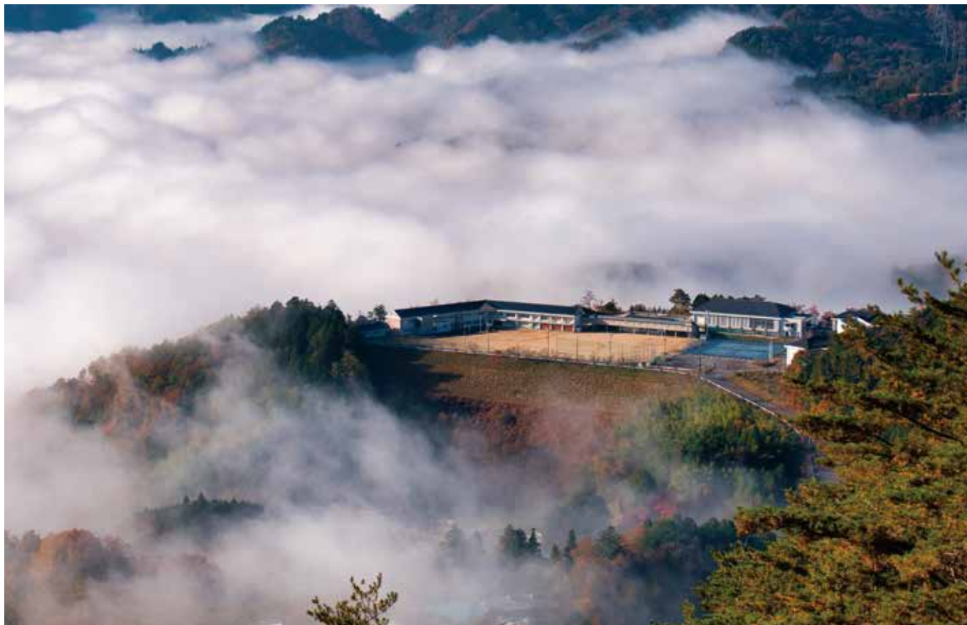
泰阜村立泰阜小学校