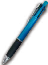
▲uniジェットストリーム多機能ペン4&1

新採用の先生方へ、ご着任のお祝いとして『 uniジェットストリーム多機能ペン4&1 』を贈呈いたします。当会参事、または共済事業（提携保険事業）提携会社ジブラルタ生命保険株式会社（ライフプラン・コンサルタント）が順次お届けに伺います。是非ご利用ください。