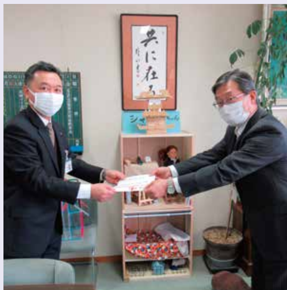
信州大学教育学部附属長野小学校にて