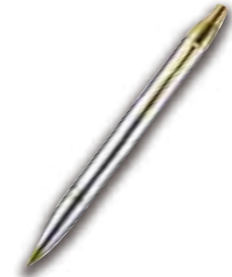
▲パーカー社製ボールペン

当会は、新任校長と新任教頭の先生方へ、ご昇任のお祝いを贈呈しています。今年度も、『 パーカー社製ボールペン 』をご用意しました。当会参事、または共済事業（提携保険事業）提携会社ジブラルタ生命保険株式会社（ライフプラン・コンサルタント）が順次お届けに伺います。是非ご利用ください。