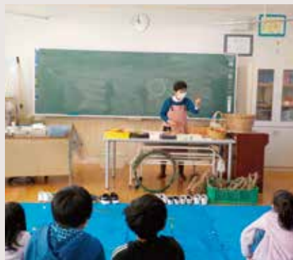
わくわく講座のお正月リースづくりの様子