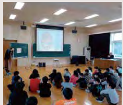
全校での俳句教室