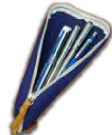
▲ペントレーになるペンケース

2022年度教弘担当者をお引き受けいただき、ありがとうございます。1年間よろしく願いいたします。お願いしたい内容につきましては、参事が伺いしてご説明させていただきます。ささやかではありますが、お礼といたしまして、『 ペントレーになるペンケース 』をプレゼントいたします。ファスナーを全開にするとペントレーになる便利なペンケースです。