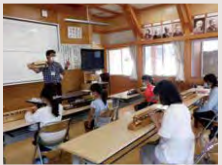
クラブ活動(大正琴)