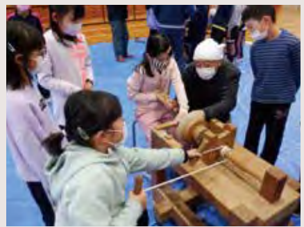
手引きろくろで木皿を作る5年生

地域の願いや特色を生かした教育活動、ICTの活用を通じた協働的な学びなどを通して、教育目標である「えがお あせ ゆめ」の具現に向けて、子どもたちも先生方も成長していく学校を目指しています。