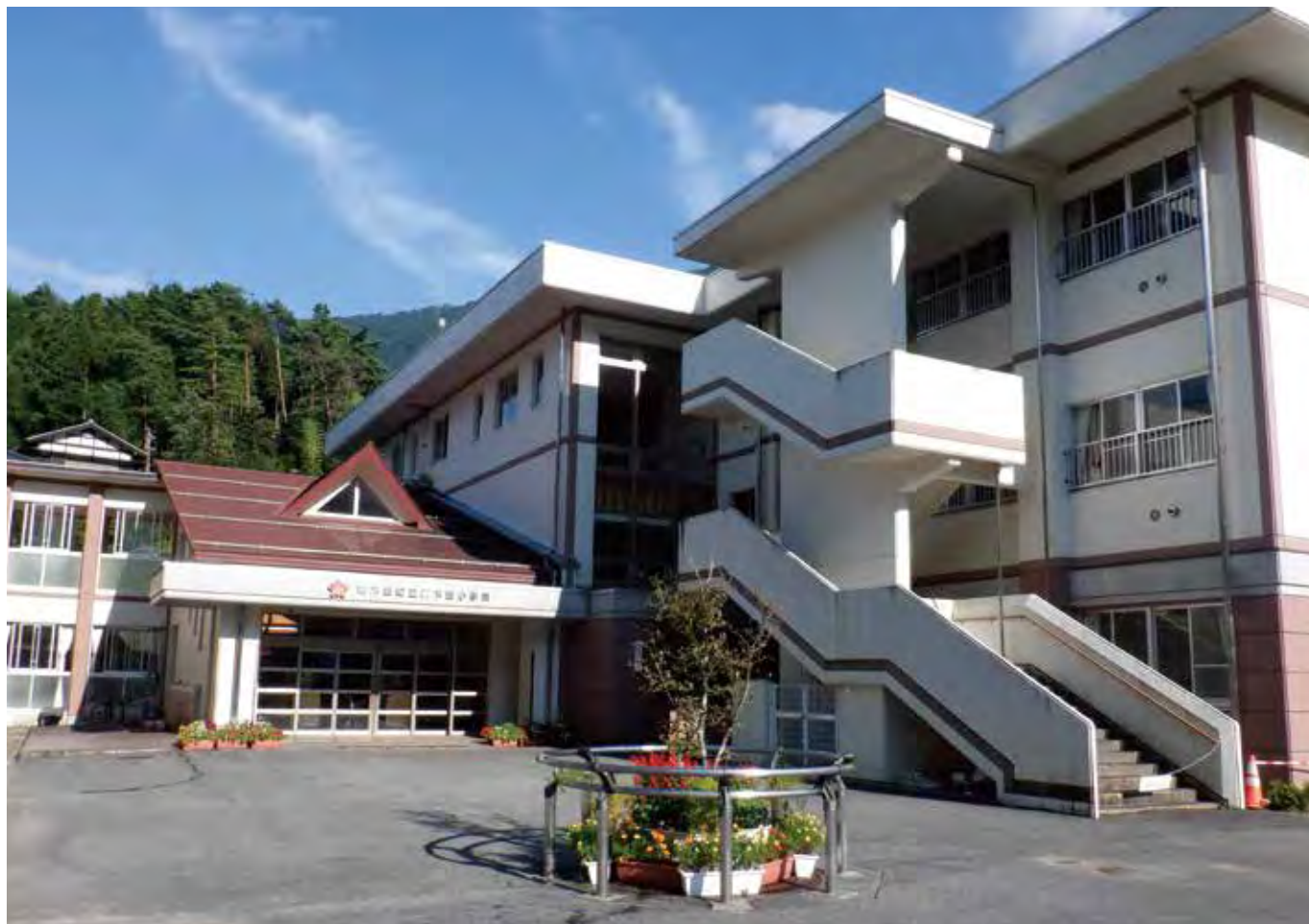
南木曾町立南木曾小学校