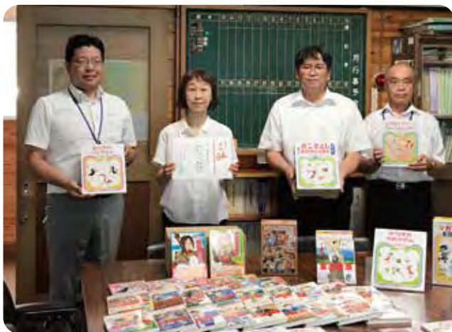
松本市立中山小学校贈呈式