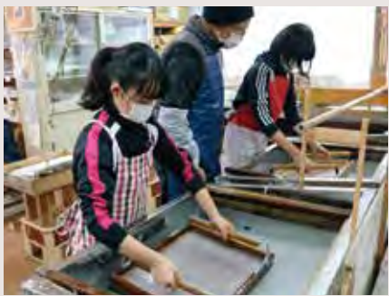
6年生の紙漉き(卒業証書づくり)