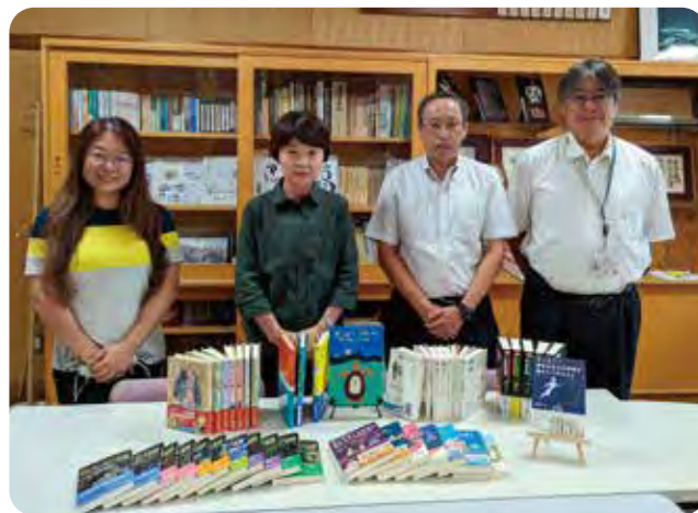
上田市立塩田西小学校