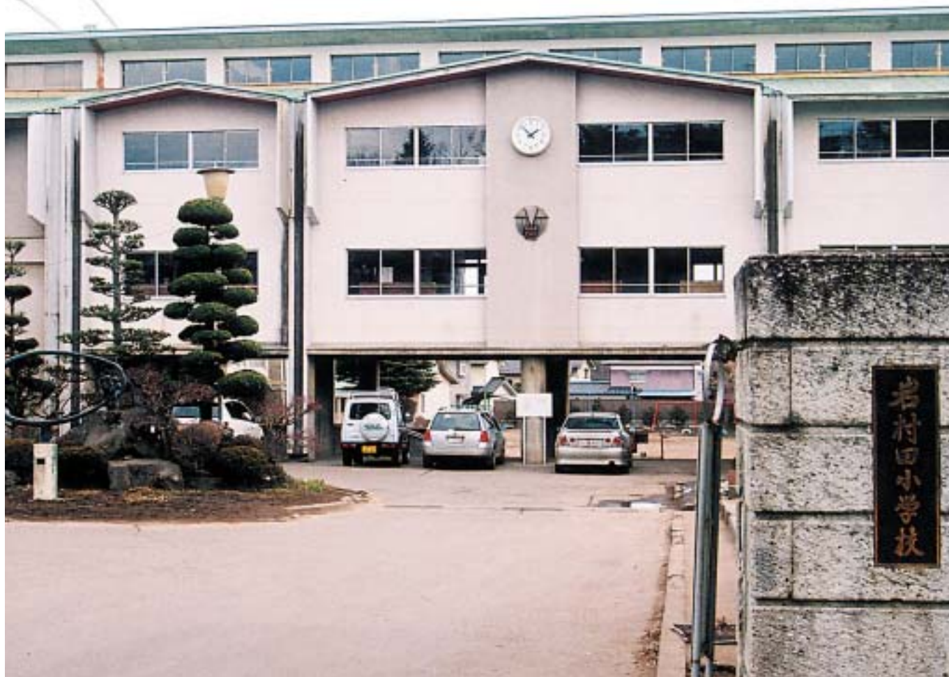
佐久市立岩村田小学校