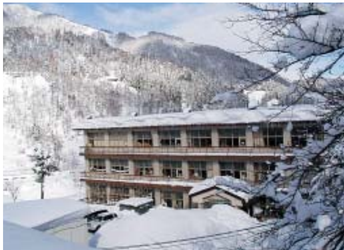
小谷村立南小谷小学校