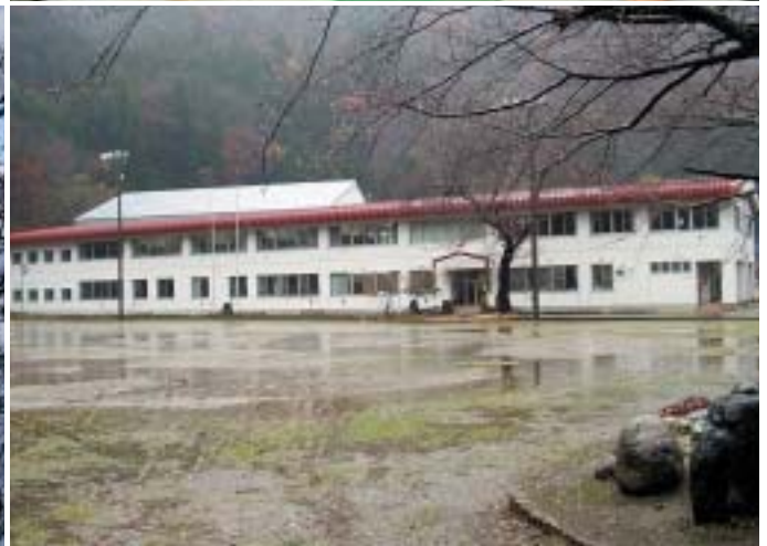
小谷村立北小谷小学校