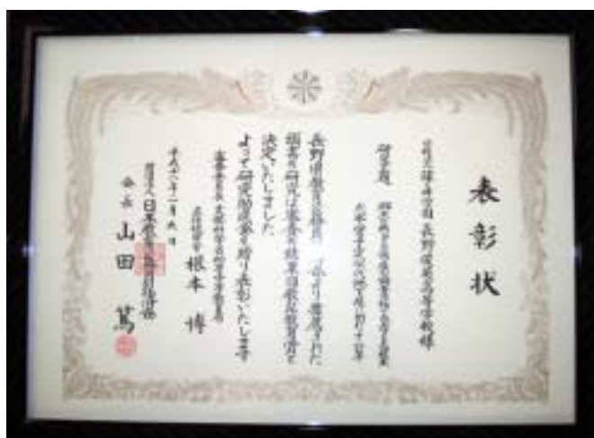
▲長野俊英高等学校

日教弘本部に代わって長野教弘より役職員が、それぞれの学校にお伺いし、賞状と賞金をお渡しし表彰いたしました。