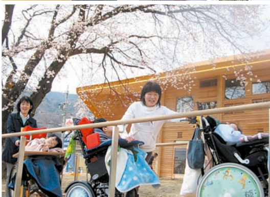
長野県稲荷山養護学校