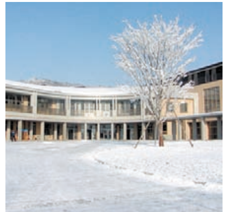
長野市立共和小学校 (学校紹介はP4)