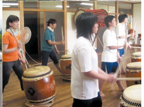
松本市立会田中学校