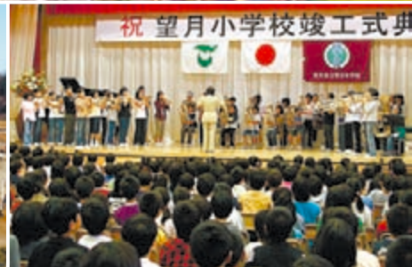
佐久市立望月小学校