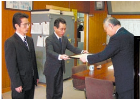
▲《学校部門》木島平村立中部小学校