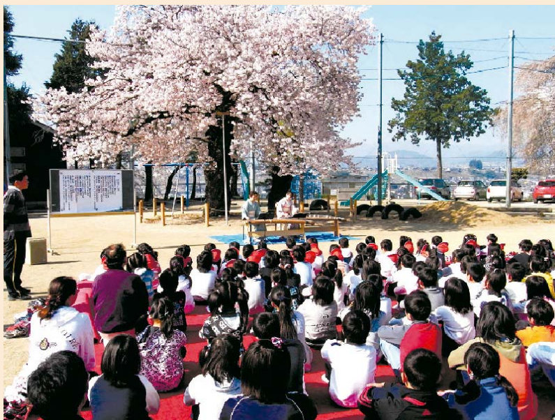
▲地域の方のお琴の演奏

追手町小学校の伝統の一つに、合唱があります。昭和31年には合唱で全国一位になり、その賞状が今も飾られています。その伝統を受け継ぎ、合唱団は今も各種のコンクールで好成績を収めています。特に昨年・一昨年はNHKコンクール県大会での金賞受賞や、子ども音楽コンクールで県の代表として東日本大会にも出場しました。今年も50名以上の団員がコンクールを目指して練習に励んでいます。この合唱団をお手本に、各学級でも歌に力を入れています。朝の学活の時間に発声練習と歌を歌い、響きのある歌声作り・学級作りを行っています。その歌を地域の人たちに聴いていただいたり、歌で交流をしたりしています。