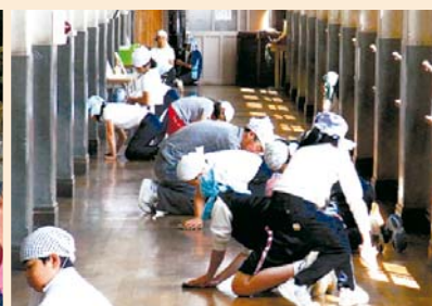
▲ベア掃除で廊下の拭き込み