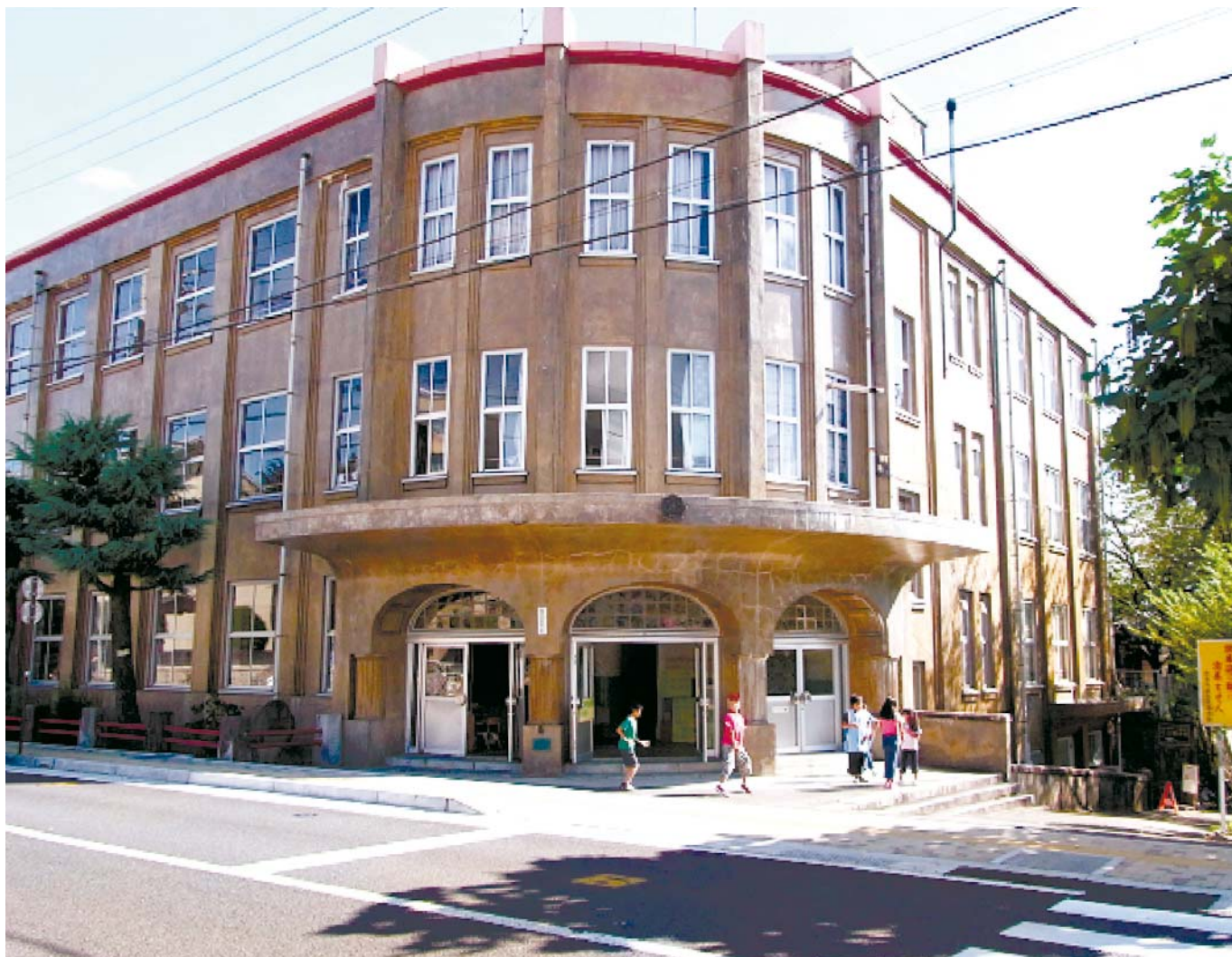
飯田市追手町小学校