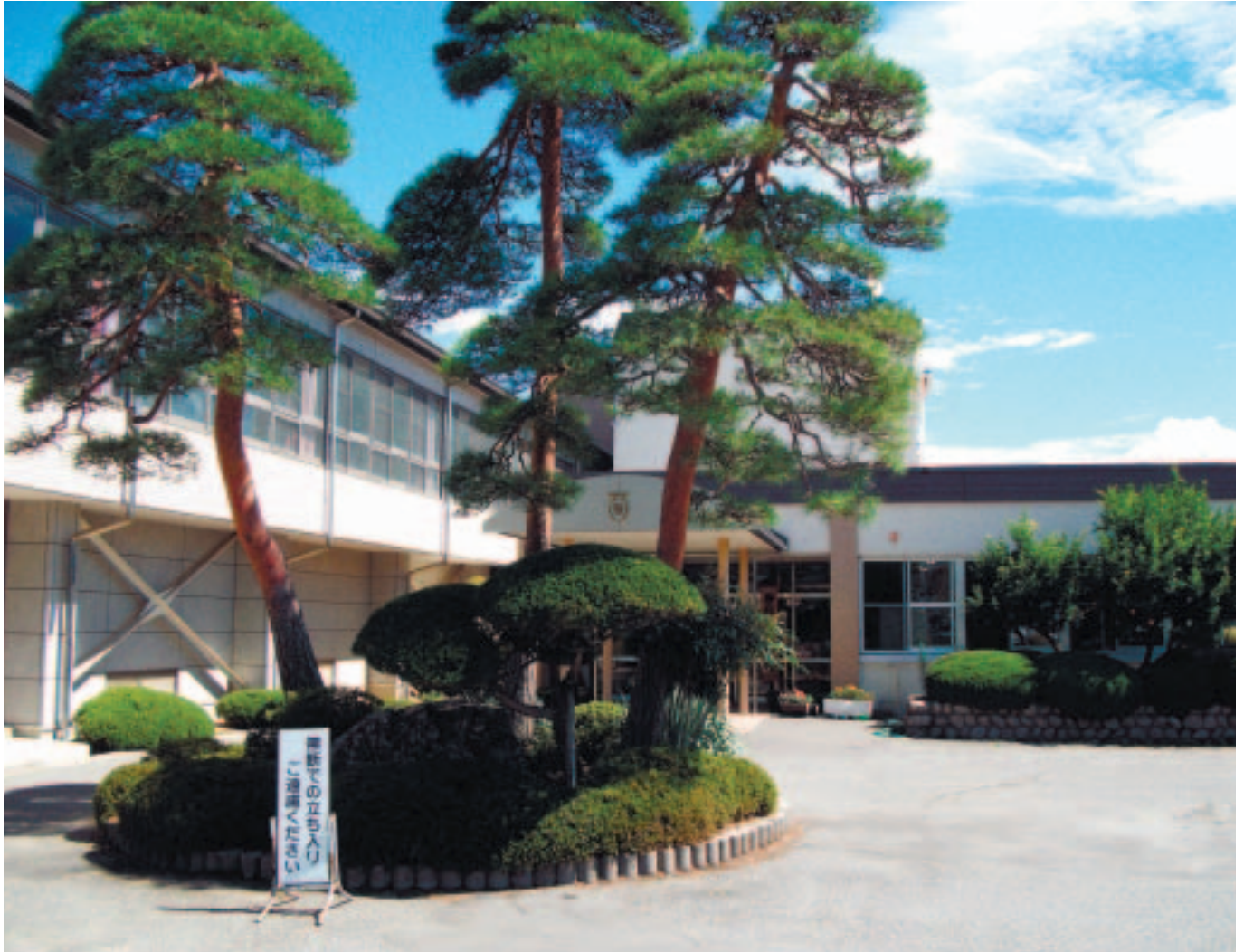
安曇野市立豊科南小学校